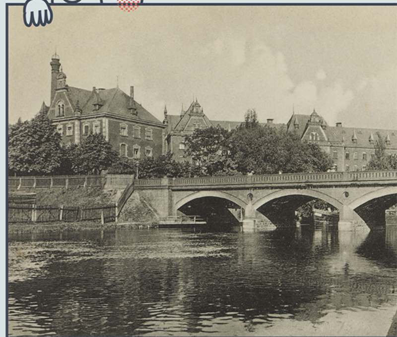
Most Królowej Jadwigi